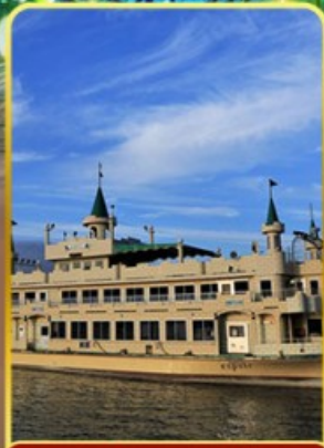
ล่องเรือทะเลสาบโทยะ