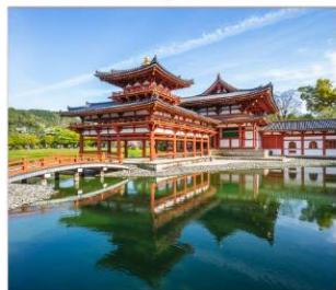
วัดเนียวโตอินและ ถนนซาเวียว