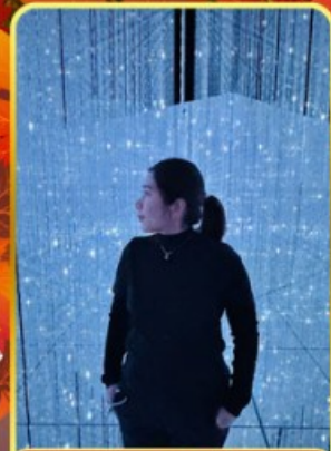
ทีมแอบโตเกียว