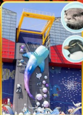
พิพิธภัณฑ์โคคุคัง