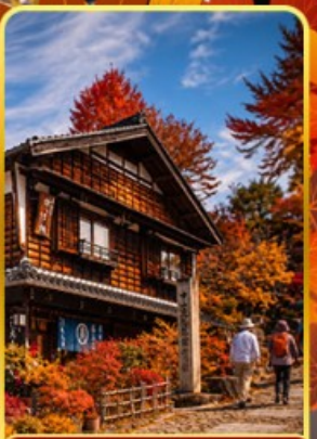
หมู่บ้านมาโกเมะจุกุ