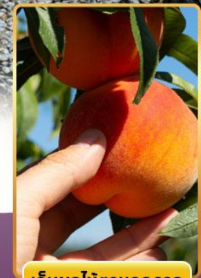
เก็บผลไม้ตามฤดูกาล