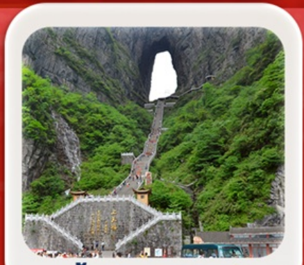
"กำประตูลิ่วหวง"