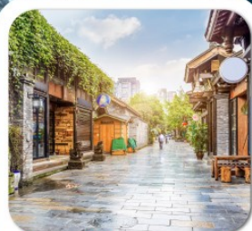
"ซองกว้างซอยแคบ"