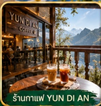
ร้านกาแฟ YUN DI AN