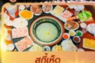
สุกั้เห็ด