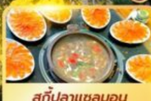
สุกี่ปลาแซลมอน