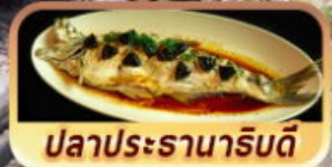
ปลาประจานาริบดี