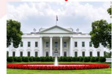
The White House

16.00 น. นำท่านเดินทางสู่สนามบินดัลเลส 21.45 น. ออกเดินทางสู่อิสตันบูล ประเทศตุรกี เที่ยวบิน TK8