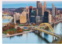
เมืองพิตส์เบิร์ก