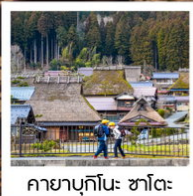
คยาบุกิโนะ: ซาโตะ