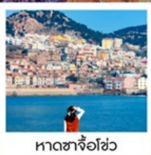
หาดซาจื่อฮั่ว