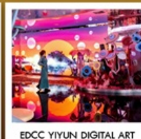
EDCC YIYUN DIGITAL ART