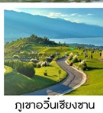
กุซาอวั้นเซียงซาน