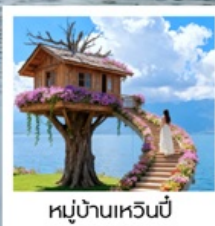
หมู่บ้านหวนยี่

เมืองโบราณต้าหลี่ / นั่งเรือสู่เกาะเสี่ยวผู่โถว / ซานโตรินี่ (รวมรถแบตเตอรี่) / ถนนทางแอร์ต้าต้า / กุซาอวั้นเซียงซาน / ต้าซ่าท่าเรือหลงกัน โค้ง S ทะเลสาบเอ้อไห้ / หมู่บ้านโบราณสี่จิว / หมู่บ้านหวนยี่ / ชมดอกไม้ตามฤดูกาล