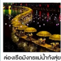
คลองเรือมังกรแม่น้ำก้งซุย