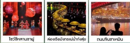
โชว์ซีหลานซาตู้