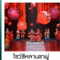
โชว์ซีหลานซาตู้