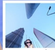
3 3D ใหญ่ ๓ แห่ง เชียงใหม่