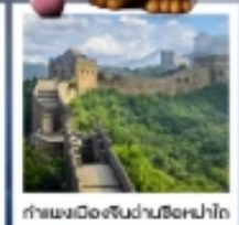
กำแพงเมืองจีนผ่านซือหม่าโต

เมืองโบราณกู่เป่ย์ซู่ยเจิ้น / กำแพงเมืองจีนด่านซือหม่าโต (รวมค่ากระเช้าขึ้น-ลง) / ชมวิวกำแพงเมืองจีนและเมืองโบราณ ยูนิเวอร์แซลปักกิ่ง (รวมค่าบัตรเข้า) / จัตุรัสเทียนอันเหมิน / พระราชวังโบราณฤดูร้อน / หอขงจื้อ คาเฟ่กาแฟบ้านน้ำตาด (TANG FANG CAFE) / พระราชวังฤดูร้อนอวิ๋เหอหยวน / ย่านชานหลี่ถุน (POP MART) / ถนนคนเดินไท่กุ่หลี่