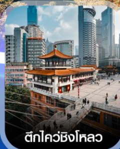
ตึกไควซิงโหลว

✈️ คอนเฟิร์มออกเดินทาง ทุกพีเรียด 2 ท่านขึ้นไป