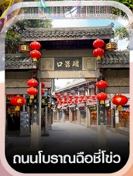
ถนนโบราณฉือชี่โฮว