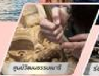
ชมวิถีชีวิตธรรมชาติ

เที่ยวเกาะใต้ และเกาะเหนือ : 12 วัน 10 คืน