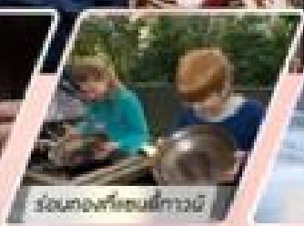
ร่วมเล่นกีตาร์ในเกาะ