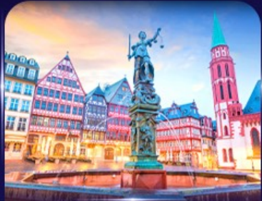
จัตุรัสโรเมอร์ แพรงก์เฟิร์ต