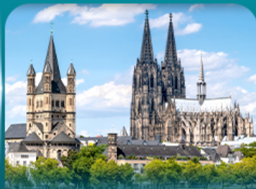
เซ็คอินมหาวิหารโคโลญ