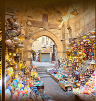
ตลาดขานเอลคาลีลี