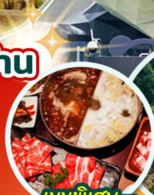
เมนูพิเศษ ชาบูหม่าล่า