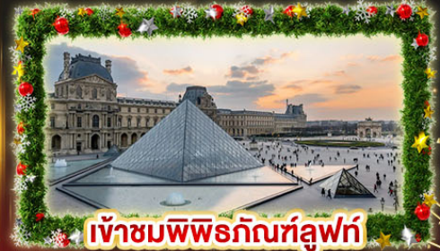
เข้าชมพีพีร์กันท์ลูฟท์