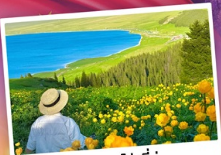
ทะเลสาบโซห์ลีมู่

ถ่ายรูปทุ่งดอกลาเวนเดอร์ - กุ้งหนัวคาลาจัน SKY GRASSLAND กุ้งหนัวมรดกโลก