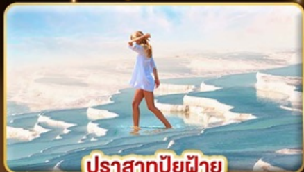
ปราสาทบูยฝาย