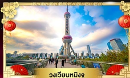
วงเวียนหมีงู