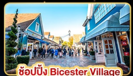
ช้อปปิ้ง Bicester Village