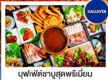
บุฟเฟ่ต์ซาบุดะพรีเมียม