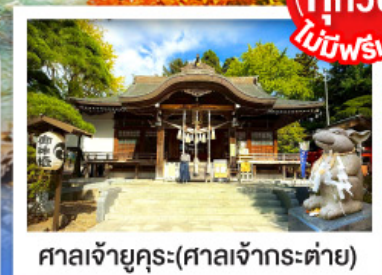
ศาลเจ้าคุระ (ศาลเจ้ากระต่าย)

พิเศษบุฟเฟ่ต์ซาบุดะพรีเมียม ปูออกโทโด อาหารทะเล เนื้อวากิว สเต็ก ซูชิอิสระ และเครื่องดื่มไม่อัน