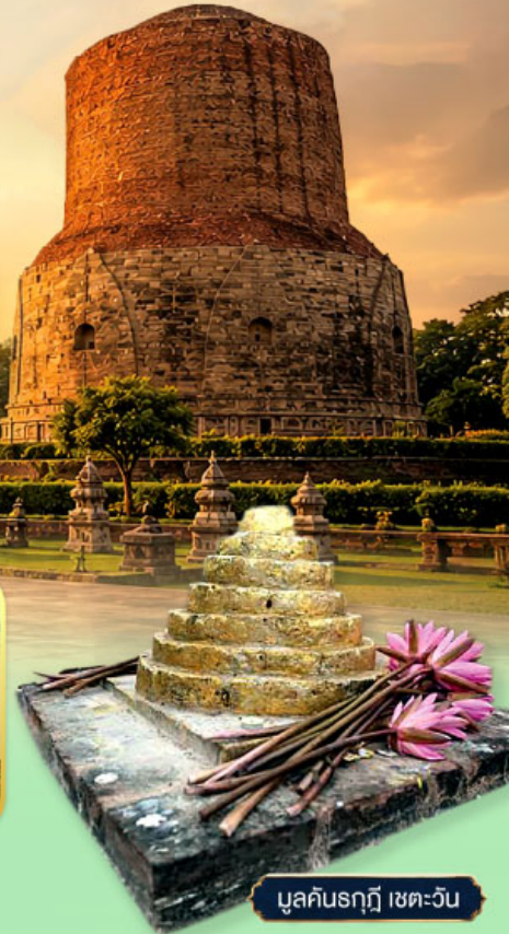
มุลคันรฤฎี เขตตะวัน