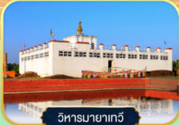
วิหารมายาเทวี