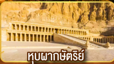
หุบผากษัตริย์