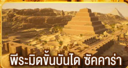
พีระมิดขั้นบันได ชัคคาร์่า