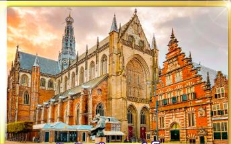
จัตุรัสเมืองฮาร์ลิม

พรมแดนเมืองเปลาเกเนเธอร์แลนด์และเบลเยียม เติมนเมืองเคลฟท์ เมืองเครื่องปั้นดินเผาระดับโลก ฮาร์ลิมเมืองมั่งคั่งที่สุดของเนเธอร์แลนด์