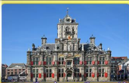
อาคารเมืองเก่าคลองเมืองเคลฟท์