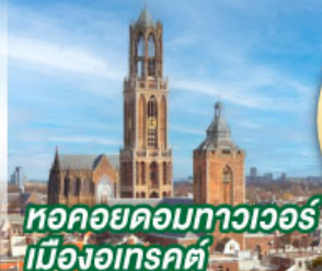
หอคอยคอกทาวเวอร์ เมืองอูเทรคต์