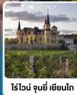
ไร่ไวน์ จุนยี่ เยียนโก