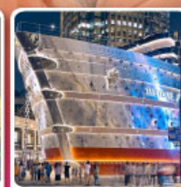
เรือหลุยส์