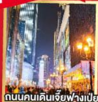
ถนนคนเดินเจียวฟางเป่ย์