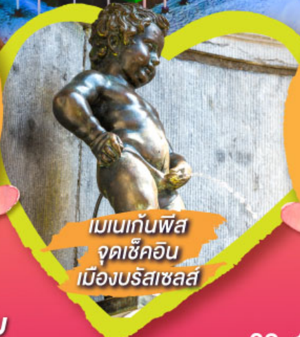
เมเนกันพีส จุดเช็คอิน เมืองบรัสเซลส์