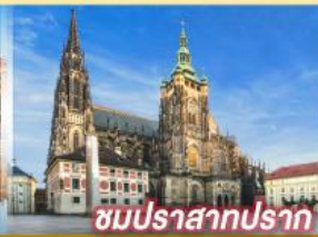
ชมปราสาทปราท