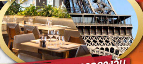
รับประทานอาหารกลางวัน บนหอไอเฟล