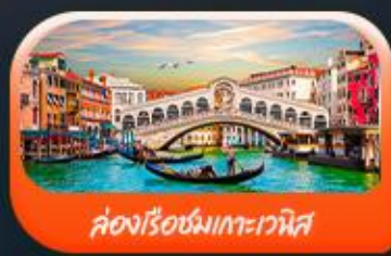
คลองเรือชมเกาะเวนิส