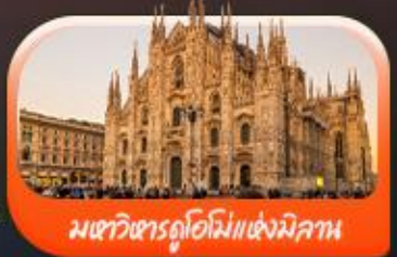
มหาวิหารดูโอโมแห่งมิลาน