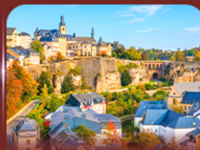
ย่านเมืองเก่า ลักเซมเบิร์ก