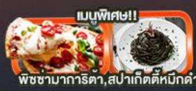
เมนูพิเศษ!! พิซซ่าการิตตา, สปาเก็ตตี้หมักดำ