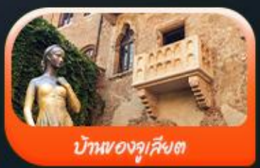
บ้านของจูเลียต

พิเศษ ขึ้นกระเช้าชมวิวเขาโดโลไมท์ ALPE DI Siusi