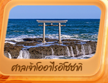
ศาลเจ้าโองาโองาโรชิซาทิ

แพคเกจใกล้ชิด "ฟูจิซัง" ที่หมู่บ้านโอชิโนะ อักโก สวนโออิชิปาร์ค ที่เที่ยว Unseen นั่งกระเช้าชมวิวภูเขาฟูจิ ทะเลเจ้าโองาโองาโรชิซาทิ เสาโทริอิริมทะเล อลังการโบสถ์แปดเหลี่ยม น้ำตกเคงอน ศาลเจ้านิกโกโทโชกุ เสริมมงคล วัดพระใหญ่อุซึคุ โดบุทสึ ห้ามพลาดโคมแดงยักษ์ วัดอาซากุสะ อิมมอร์ทัลตลาดปลาโทโยสุ ภัตตาคารแนว 3D ย่านชิจูกุ ซุปปิ้งจุกุโงะดันงิชิบูยะ