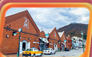
โกดังอิฐแดง

สายการบิน Thai Airways (TG) น้ำหนักกระเป๋า 23 KG