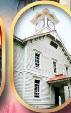
ผ่านชมหอนาฬิกา