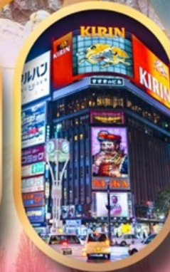
ช้อปปิ้งย่านซูซุกิโนะ