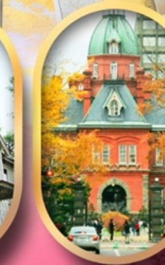
ศาลาว่าการเก่า