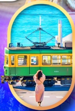
ถนนโคมาจิโคริ