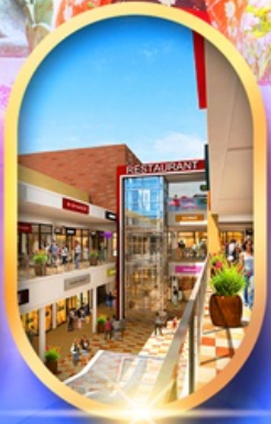
มิตซุชิอากะอิเคอิ