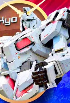
ห้างไอโดปะกับดัม