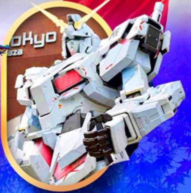
ห้างไอโดะกันดัม