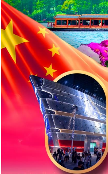
เรืออะทลันติก