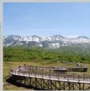
"SHIRETOKO 5 LAKE"