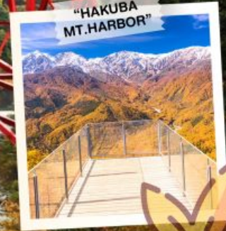
"HAKUBA MT. HARBOR"

วันเดินทาง 28 ต.ค. - 3 พ.ย. 2569 4 - 10, 11 - 17 พ.ย. 2569