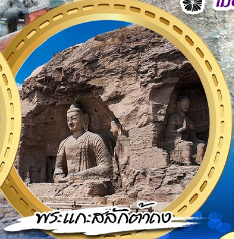
พระแกะสลักต่าง