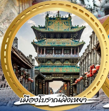
เมืองโบราณผิงเหยา