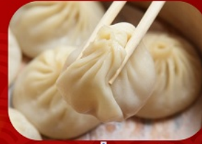
พิเศษ!! เสี่ยวหลงเป่า