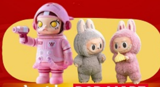
ช้อปปิ้ง POP MART