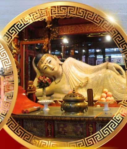
วัดพระหยกขาว