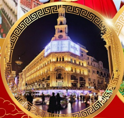
ถนนคนเดินหนานจิง

เดอะบรันด์ หาดไต้หวัน ขึ้นหอไข่มุก อิสระ เชียงใหม่ ดิสนีย์แลนด์ วัดหลงหัว อายุมากกว่า 1700 ปี สักการะวัดพระหยกขาว สวนอีหวนกว่า 400 ปี สตาร์บัค ใหญ่ที่สุดในเอเชีย ช้อปปิ้งถนนโบราณชื่อดัง