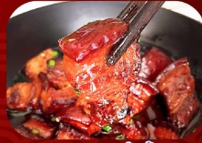
พิเศษ!! หมูสามชั้นน้ำแดง