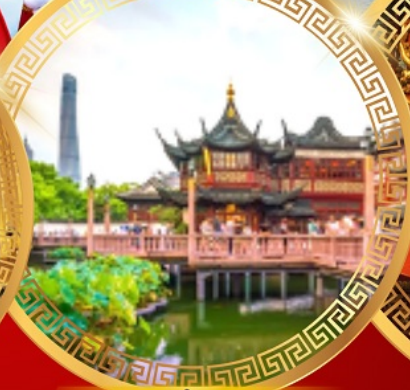
สวนอีหวน